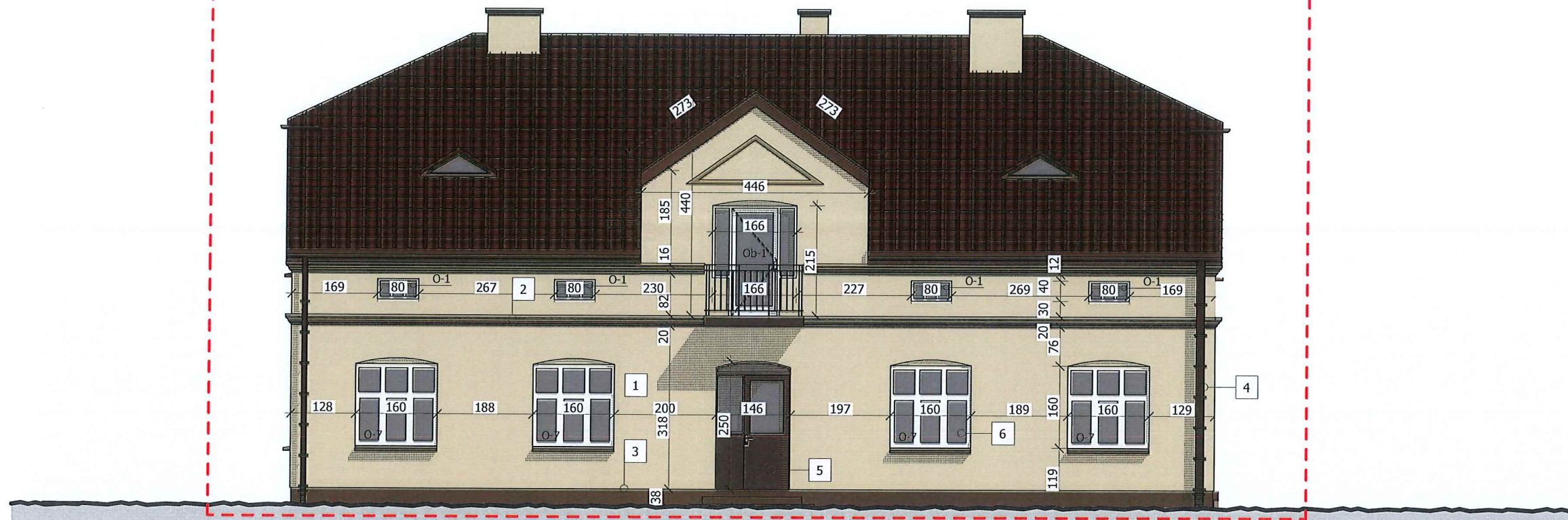
ELEWACJA ZACHODNIA - E1

BUDYNEK STAREJ SZKOŁY WPISANY DO GMINNEJ EWIDENCJI ZABYTKÓW